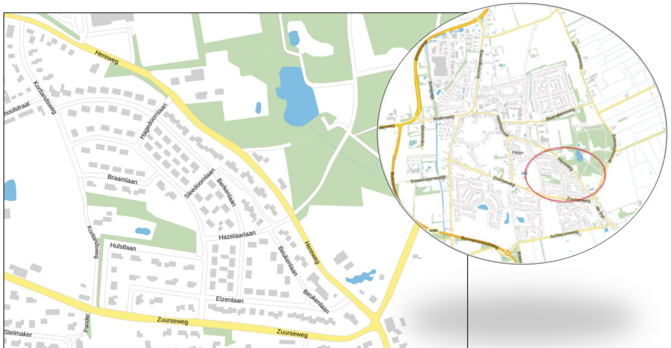
Figuur: locatie Kortland Peize